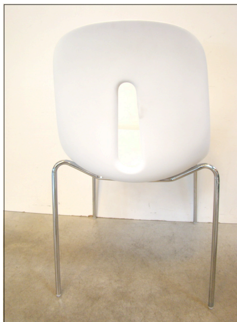
Vista da dietro